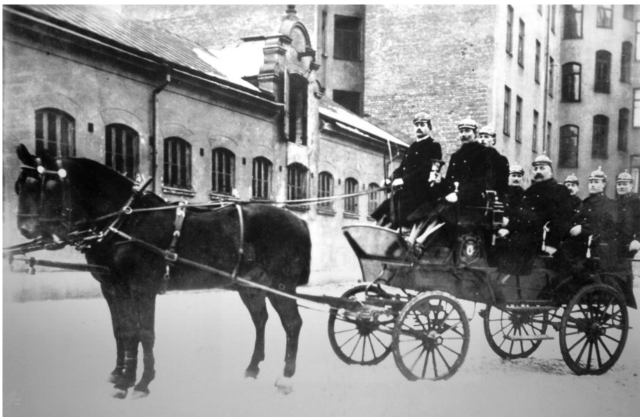
Piketen Ostermalm 1911.