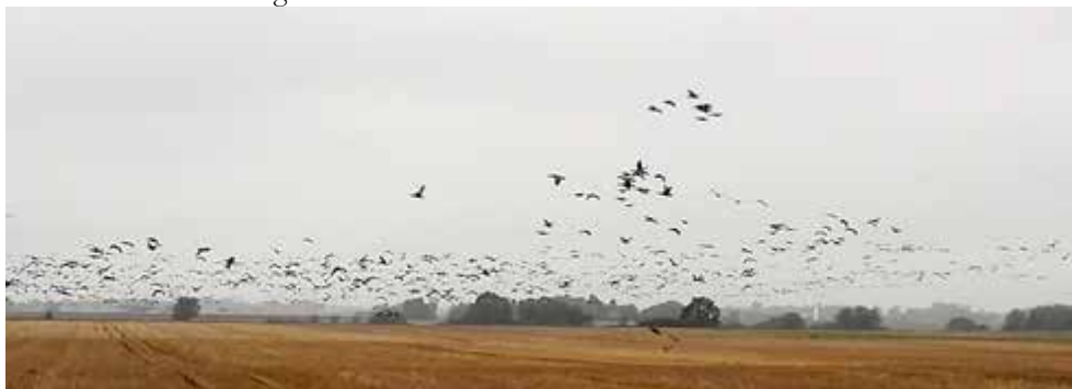
Detta är inte NGS:s originallogga.

Bilden av fåglar som svärmar drar tankarna till ett system för kollektiv självorganisering, där tusentals fåglar rör sig i en sammanhållen grupp och hur formationen organiskt förändras och byter skepnad utifrån yttre faktorer, utan uppenbar ledning, riktning och ordning – till synes automatiskt, som om de är kontrollerade av en osynlig hand (Hemelrijk & Hildenbrandt 2011).