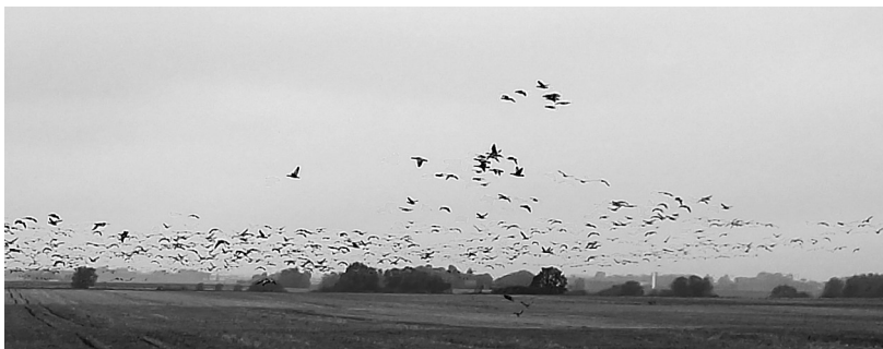
Bild 3. Svärmande fåglar i formation (detta är inte NGS:s originallogga utan bilden används som en illustration). Foto: Hanna-Beata Christensson 2017.

kollektivet blir anfallet eller när det möter ett hinder i miljön reorganiserar det och ändrar form, men utan att gemenskapen löses upp. Svärmande fåglar är med andra ord en hållbar och motståndskraftig (resilient) kollektiv självorganiseringsstruktur och ett exempel på organisk komplexitet, som innebär att resultaten, riktningen och utvecklingen inte är ”kända, förutsägbara eller kontrollerbara” (Chandler 2014, s. 171, min översättning).