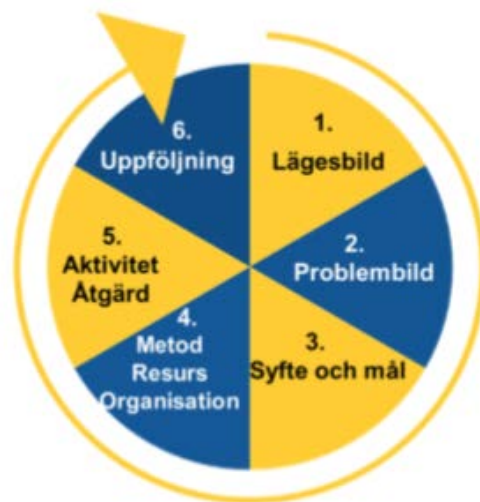
Figur 1. Trygg i modellen.

Trygg i konceptet består av sex steg i kronologisk ordning. En lägesbild tas fram av respektive part (primärt polis och kommun, inom ramen för TFG även IFK Göteborg), utifrån lägesbilden tas en problembild fram där orsaksanalyser för problemen genomförs. En gemensam åtgärdsplan tas därefter fram, vilken implementeras och slutligen följs upp. Processen fortsätter sedan med en ny lägesbild och kan därmed sammanfattas med den cirkel som syns i Figur 1.