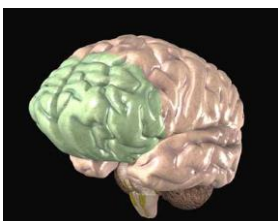
Figur 1. Prefrontal cortex (Fastan, 2010)

Prefrontal cortex (PFC) huvuduppgift är att ta emot signaler från andra delar av hjärnan och att skicka signalerna vidare. Med andra ord samspelar PFC med andra delar av hjärnan när situationer uppstår som bidrar till moraliska handlingar. (Yang, 2008). PFCs roll omfattar framför allt kognitivt och socialt beteende, personlighetsuttryck och beslutsfattande. Med hjälp av magnetisk resonanstomografi (MRI) har flera forskare kommit fram till slutsatser som tyder på att skador eller brister i prefrontal cortex bidrar till psykopat liknande störningar såsom emotionella och personlighetsförändringar, exempelvis eufori, brist på empati, ansvarslöshet, brist av oro för framtiden och ökad fysisk aggressivitet (Blair et al, 2005; Yang, 2008). Ett primärt exempel på detta är fallet om Phineas Gage, som utvecklade psykopatiska personlighetsstörningar efter sin olycka (Gao et al, 2009). Bilden nedan illustrerar var prefrontal cortex sitter.